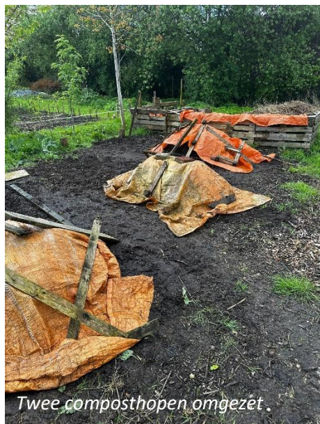
Twee composthoopen omgezet

voor verse bloemen op de tafels in en rondom de keet. Dit geeft onze pauze plek een zeer fleurig uiterlijk.