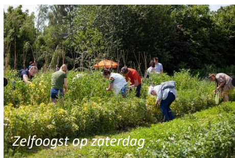
Zelfoogst op zaterdag

Dit jaar organiseerden we een Open Dag samen met onze burens van Tuinderij de Mijmering, de Zorgtuin en Dutchmoors Schapen. Op zaterdag 17 juni 2023 trokken we weer veel bezoekers uit Arnhem en omstreken. Veel mensen maakten via de Open Dag voor het eerst kennis met ons.